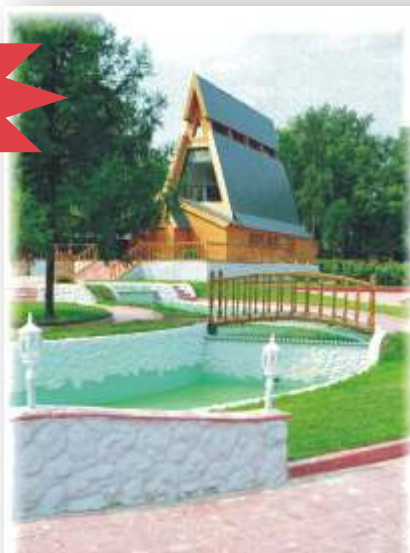
Ресторан "РУСЬ" Бассейны покрашены Резиновой краской №10

- Новые листы оцинкованного железа покрыты слоем жирной смазки и эту смазку необходимо тщательно удалить какими-либо растворителями. Но лучше предоставить это солнцу и непогоде. За 1-2 года они справятся с этой работой.